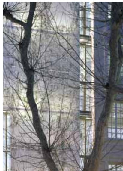
FAÇADE MARBRE VERRE