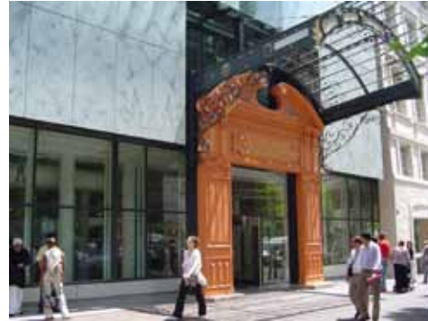
ENTRÉE SUR LE COURS BELSUNCE

LIEU : VILLE DE MARSEILLE SURFACE : 21 000 m 2 (SHON) PRIX : 30 200 000 € HT OUVERTURE : 2004 ARCHITECTES : ATELIERS AFA DIDIER ROGEON B.E.T. : BETEREM MAÎTRE DE L'OUVRAGE : VILLE DE MARSEILLE MARSEILLE AMÉNAGEMENT MISSION : BASE LOI M.O.P.