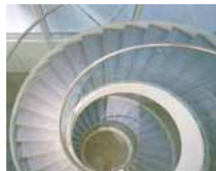
SALLE DE LECTURE ESCALIER SALLE DE CONFÉRENCE