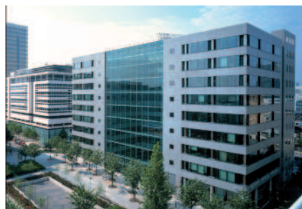
VUE D'ENSEMBLE RUE GEORGES BALANCHINE

Le bâtiment dispose d'un hall central traversant largement ouvert sur l'extérieur. Du côté de la Place Jean Vilar et du Square James Joyce un atrium toute hauteur prolonge le square à l'intérieur de l'immeuble.