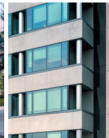
DÉTAIL DE FAÇADE