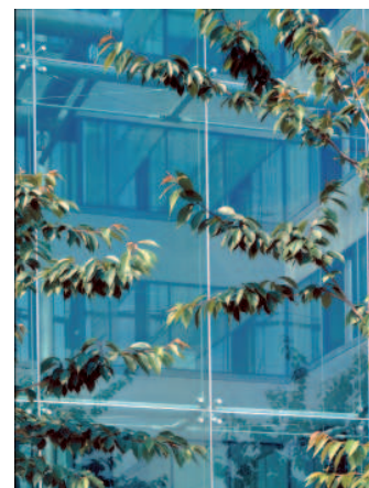
DÉTAIL DE FAÇADE