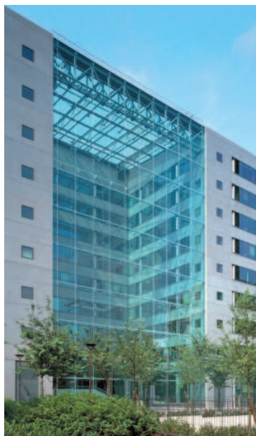
FAÇADE RUE GEORGES BALANCHINE

Le bâtiment dispose d'un hall central traversant largement ouvert sur l'extérieur. Du côté de la Place Jean Vilar et du Square James Joyce un atrium toute hauteur prolonge le square à l'intérieur de l'immeuble.